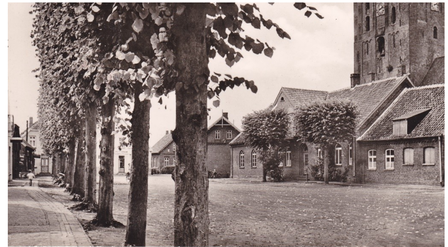
Marktplatz und Alte Schule

der ev.-luth. Kirchengemeinde Upgant-Schott und Marienhafen